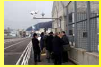
写真2:路面性状センサーの 公開状況

これは、路面の状態をAR予測モデルによって予め係数化(推定)しておき、判定事象が発生したときの係数が正常(乾燥)か異常(凍結)のどちらに近いかを「マハラノビスの距離」を用いて定量的に判定するようにしたものです。