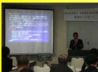
福井商工会議所での開催状況

平成17年12月12、13日、敦賀・福井両商工会議所において、第7回オープンセミナーを開催しました。このセミナーは、平成16年6月の第1回より、年4回の頻度で、地域企業の方々に原子力機構で開発された技術を紹介する場として、実施しているものです。今回のセミナーは、最先端の研究を分かりやすく紹介することとし「核融合を支える超電導技術とその波及効果」「クリープ疲労損傷の計算技術」のテーマを選定しました。