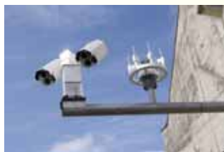
写真1:路面性状センサー(左) 気象観測センサー(右)

今回、山田技研(株)殿との共同研究の内容は、冬季の路面状態(凍結、積雪、乾燥、湿潤等)を同センサーで得られた反射率から定量的に判定するためのもので、従来判定では、過去に得られた各路面状態の反射率のデータを基に判定していたため、湿潤路面と凍結路面などの境界の判定が難しく、その判定精度は80%台でした。