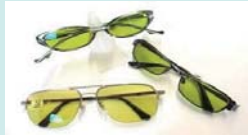
放射線照射による着色レンズ