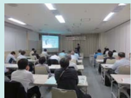
<オープンセミナー>