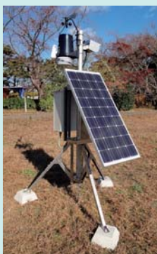
放射線測定センサー