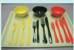
耐熱性を向上した洋食器具